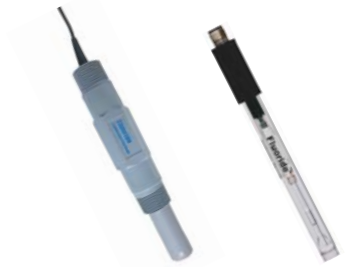
[ 이온 센서 ]